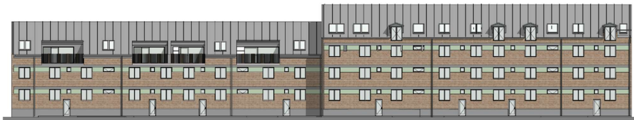
Figur 1 Illustration af fremtidig tagbolig

Projektet kommer til at indeholde familieboliger fordelt på 3 og 4 rum. For at opnå flere kvadratmeter og bedre udnyttelse af tagrummet, hæves taget med ca. 50 cm, hvilket giver mulighed for efterisolering og lysregulering mod etagen nedenunder. Forslaget kan i sin endelige udformning evt. indeholde kviste eller tagterrasser.