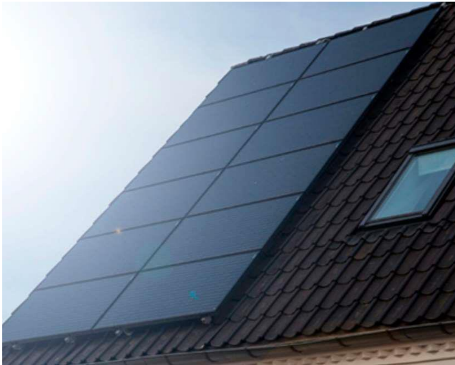
Eksempel på opsætning af solceller og anlæg